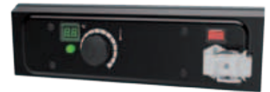
Panel de control modelos CEG