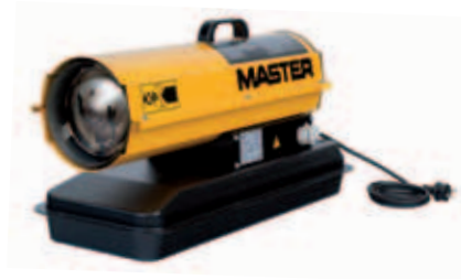
B-70 sin ruedas